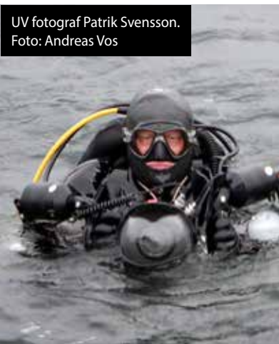
UV fotograf Patrik Svensson.