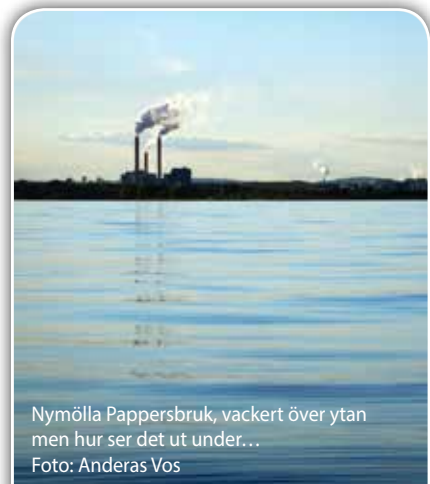
Nymölla Pappersbruk, vackert över ytan men hur ser det ut under...

Ta bort orsaken, dvs utsläppen, så återhämtar sig ekosystemet.