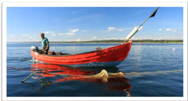
Ålfiskare i Hanöbukten ..+

Vi har också i dagarna skickat ett öppet brev till våra politiker med uppmaningen om att göra om och göra rätt – Miljöpröva fisket . Vi har redan fått en hel del reaktioner vilket är positivt. Vi hoppas givetvis att miljön och havet också kommer upp på agendan vid det kommande valet, havet är i allra högsta grad i behov av detta....och vi kan faktiskt tillsammans se till så att våra beslutsfattare går från tanke till handling.