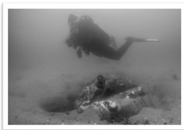
Frieslands troliga vrakplats, dykare ovanför en oljetank ...+

Halifax-projektet är bland några projekt som lidit kraftigt av just inställda dyk. Ett annat exempel är Friesland (Focke Wulfen) där även sökandet från ytan varit mycket svårt att genomföra.